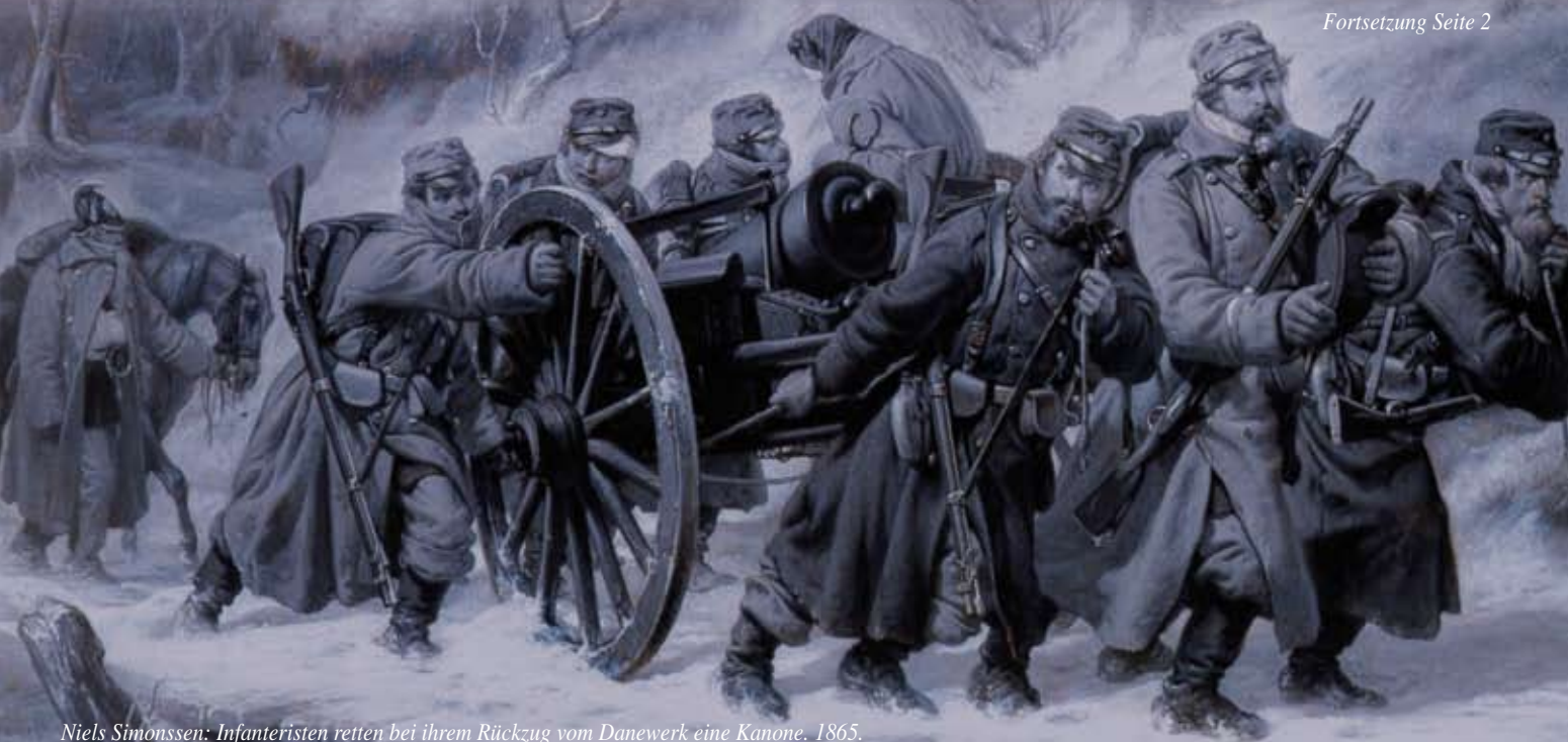
Niels Simonssen: Infanteristen retten bei ihrem Rückzug vom Danewerk eine Kanone. 1865.