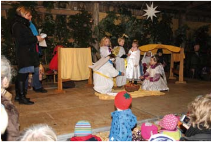
Die Kinder vom ADS Naturkindergarten Oeversee spielten „Das Geschenk der kleinen Engel“