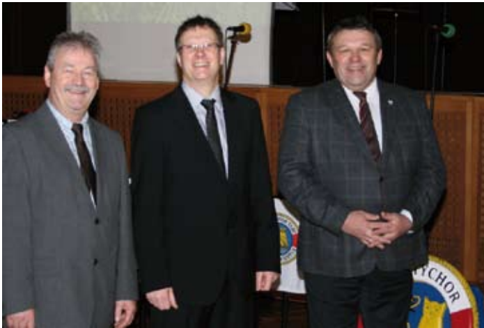
Viele interessierte Bürger informierten sich auf dem Neujahrsempfang in Tarp über das Angebot der dort vertretenen Tarper Vereine