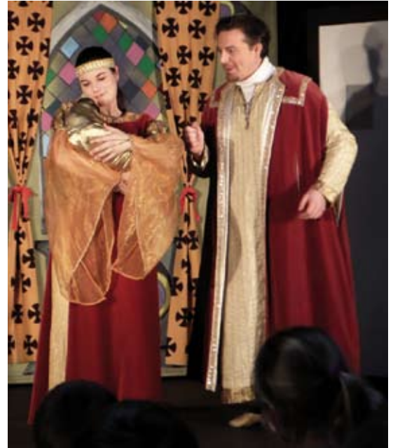
Der König und die Königin sind glücklich: Endlich haben sie eine Tochter

Schon zum zweiten Mal gastierte die Bühne Morgenstern in diesem Jahr in Sieverstedt. Fünf Schauspieler in prächtigen Kostümen zeigten auf der in der Turnhalle aufgebauten Bühne das Märchen „Dornröschen“. Nach langem Warten wird einem Königspaar endlich eine Tochter geboren. Zum Freudenfest sind zwölf Feen geladen, die das Kind mit ihren Gaben beschenken. Eine dreizehnte Fee, die nicht eingeladen war, belegt die Prinzessin mit einem Fluch. Sie soll sich an ihrem 15. Geburtstag an einer Spindel stechen und daran sterben. Zum Glück wandelt die zwölfte Fee den Fluch um in einen hundertjährigen Schlaf. Der König lässt daraufhin alle Spindeln im Königreich verbrennen. Doch die dreizehnte Fee hat vorgesorgt... Gespannt konnten die Schüler und Schülerinnen miterleben, wie die Prinzessin auf dem Weg durch das Schloss letztlich doch eine Spindel findet, sich sticht und das ganze Schloss in einen tiefen Schlaf fällt. Wie gut, dass aber auch dieses Märchen, das den Kindern außerordentlich gut gefallen hat, ein gutes Ende nimmt!